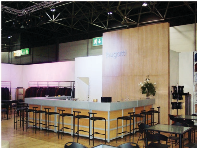
AUSSTATTUNG: 2 ECK- UND 3 GERADE ELEMENTE, FÜLLUNGEN BUCHE FURNIER