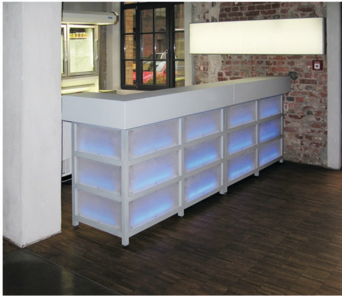
AUSSTATTUNG: 2 ELEMENTE, PLEXIGLAS BLAU HINTERLEUCHTET