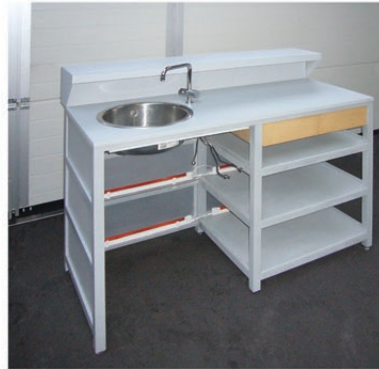
RÜCKANSICHT GERADES ELEMENT MIT SPÜLE